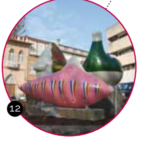
1 - GALO DE ASSOBIO Largo da Porta Nova