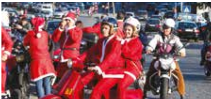
Desfile de pais natal em duas rodas