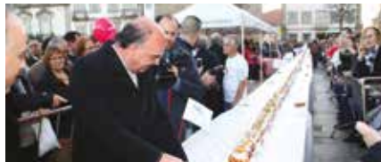
Bolo rei gigante, de 40 metros, ocupou o Largo da Porta Nova