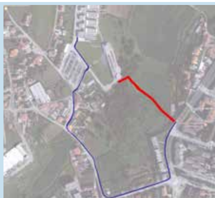
Percurso existente antes da obra. Novo percurso (acesso Pedonal)

da cidade, do concelho e da região”. Uma cerimónia que contou com a presença do Ministro da Economia, Manuel Caldeira Cabral. No final da inauguração, todos os presentes fizeram o percurso a pé até ao IPCA, local onde o Ministro proferiu uma conferência subordinada ao tema “O papel das Instituições do Ensino Superior no desenvolvimento económico das regiões”.