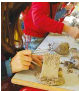
Férias de Natal no Museu de Olaria