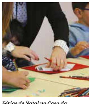
Férias de Natal na Casa da Juventude