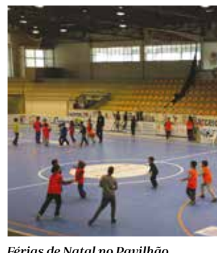
Férias de Natal no Pavilhão Municipal