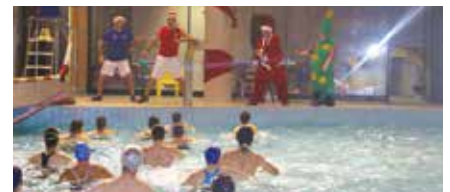
Piscinas Municipais mega aula de hidroginástica.