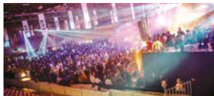
"Barcelos É Mágico" contou com muita música, animação e festa pela noite dentro.