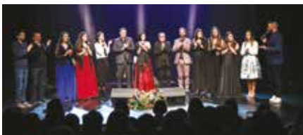
Noite de Fados do Projeto Artístico no Teatro de Gil Vicente