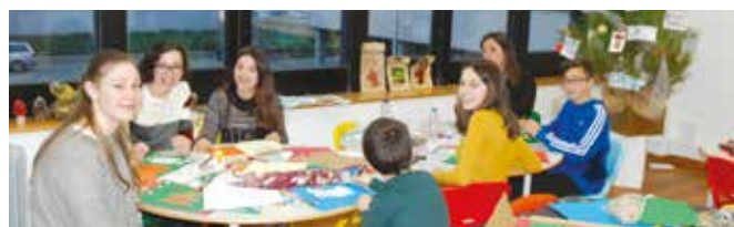
Férias de Natal na Galeria Municipal

Construções de lanternas, pintura de azulejo, confeção de pão de natal, pintura de peças em barro, criação de presépios, oficina de contos e lendas, teatro, música, jogos, construção de fantoches de esponja, hóquei em patins, judo, karaté, futebol, voleibol, xadrez, jogos pré-desportivos e muito mais, foram algumas das atividades que o Município de Barcelos organizou, no período de férias escolares de Natal.