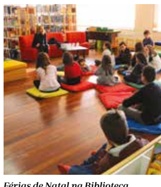
Férias de Natal na Biblioteca Municipal