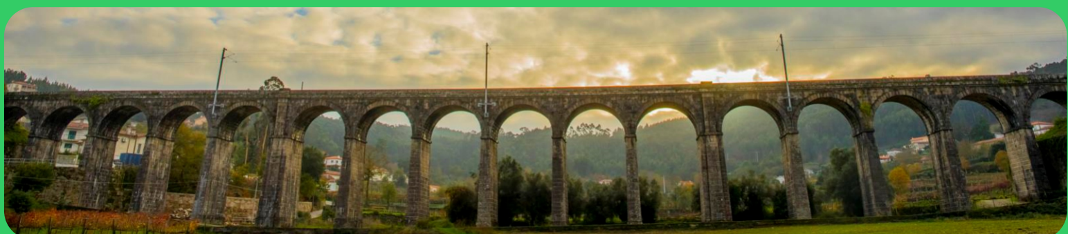
Ponte seca | Seca bridge