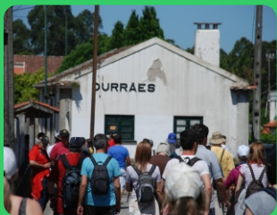
Apeadeiro de Durrães Railroad stop