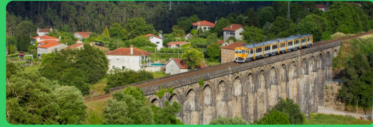
Ponte seca | Seca bridge

Pelos caminhos da Chã de Arefe Through the Paths of Chã de Arefe