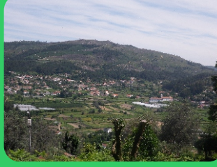
Vista sobre o Vale do Neiva View over the Neiva Valley