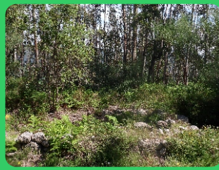
Picoto dos Mouros