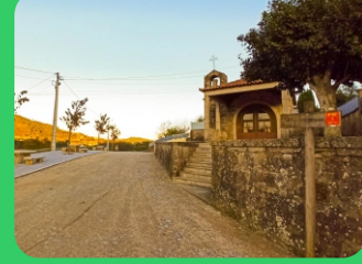
Capela de S. Miguel St. Michael's Chapel