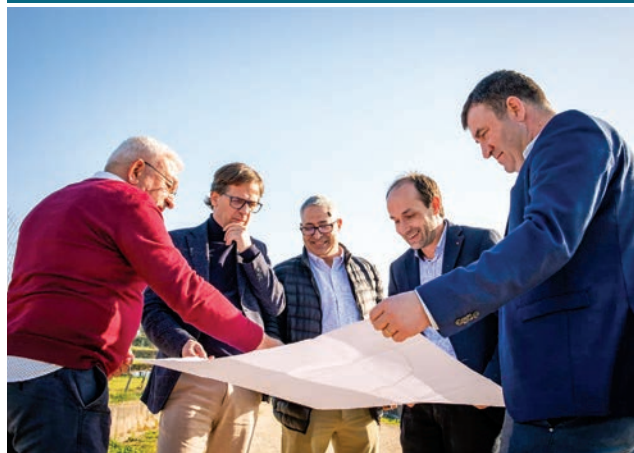
CARREIRA E FONTE COBERTA