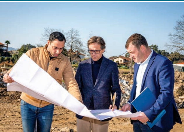
GALEGOS SANTA MARIA