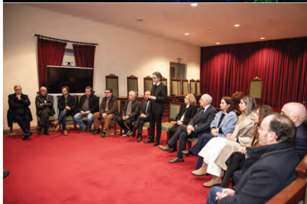
Comissão Executiva Apresentação do Programa das Comemorações.