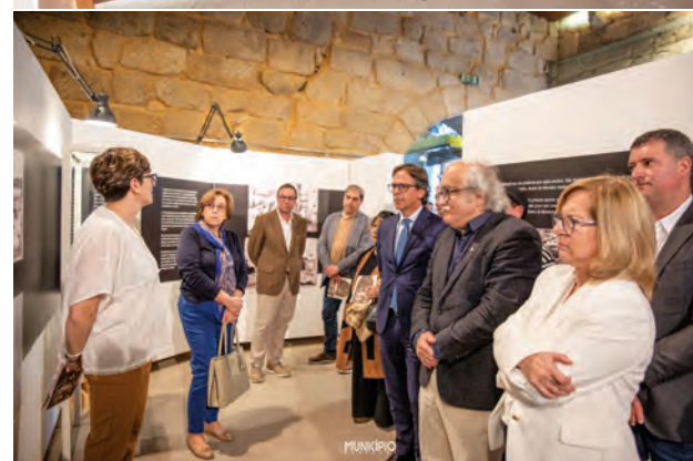
EXPOSIÇÃO "Archivum | 50 anos | 25 de Abril" Sala Gótica dos Paços do Concelho | De 22 de março a 3 de novembro de 2024.