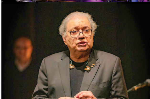
Concerto "50 anos de Abril. Parabéns a nós" Fernando Tordo, no Teatro Gil Vicente.